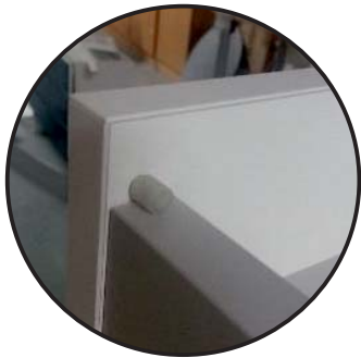
Stops at Continental Tower

Pull up the back and move the attachments to the opposite side. At Continental Tower are 2 stops in the upper edge which must be removed. Put down the back again, install eventually stops. Move also the upper (the loose) shelf.